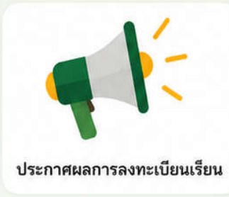
ประกาศผลการลงทะเบียนเรียน