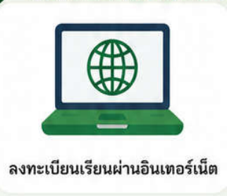
ลงทะเบียนเรียนผ่านอินเทอร์เน็ต