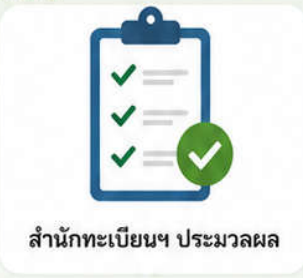
สำนักทะเบียนฯ ประมวลผล