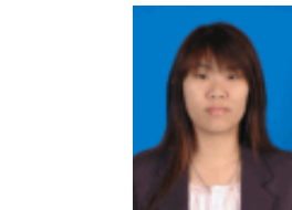
ชุดสุภาพ กรณีกำลังศึกษา เฉพาะบัณฑิตวิทยาลัย