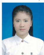
ชุดนักศึกษา